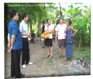
โครงการออกตรวจประเมินประกวดหมู่บ้าน “หมู่บ้านสุขภาพดี วิถีพอเพียง” เมื่อวันที่ ๑๕ - ๓๐ พ.ค. ๒๕๕๕